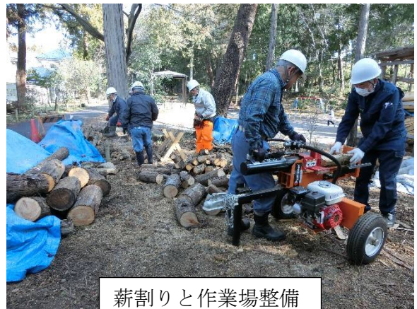
薪割りと作業場整備