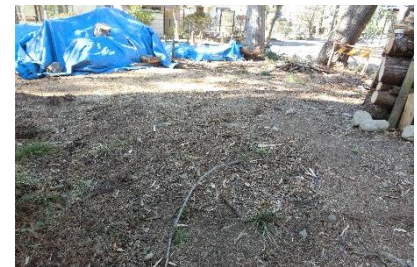
きれいになった薪割り作業場