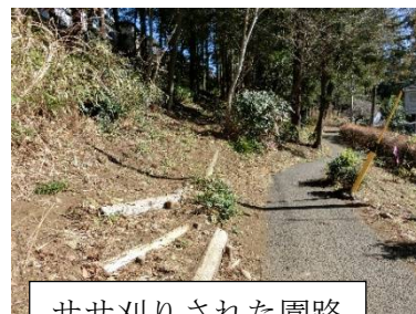
ササ刈りされた園路

同時に、強風の中、第2広場の枯れたコナラ（→）の枝切り・片付けもしてもらいましたが、その後また（風速約28m/s）によって枝が落下しました（前頁写真と比較）。松の枝も落ちていました。