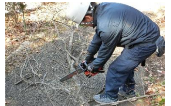
奥階段近くの落下枝木の片付け

次いで、グリーントリム公園裏の出口階段近くのトキワマンサクの元に枯れ枝が山となり、傍のコナラの枯れ枝が折れて空中ブランコしていました。落下した枝木を取り除き、また太い枝が折れそうなので高枝切り鋸で切り落としました。いずれも園路の頭上で起きた(あるいは)起きています。